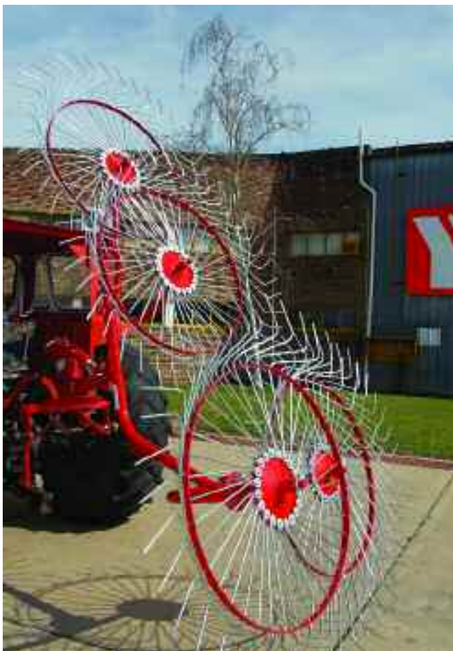
Rastrillo HRP-4 posición de transporte. Ancho de transporte 1,40 metros.