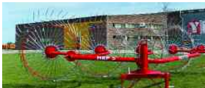
Rastrillo de entrega lateral HRP-5 / HRP-5 Side delivery rake