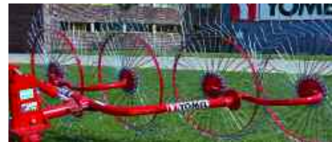
Rastrillo de entrega lateral HRP-4 / HRP-4 Side delivery rake